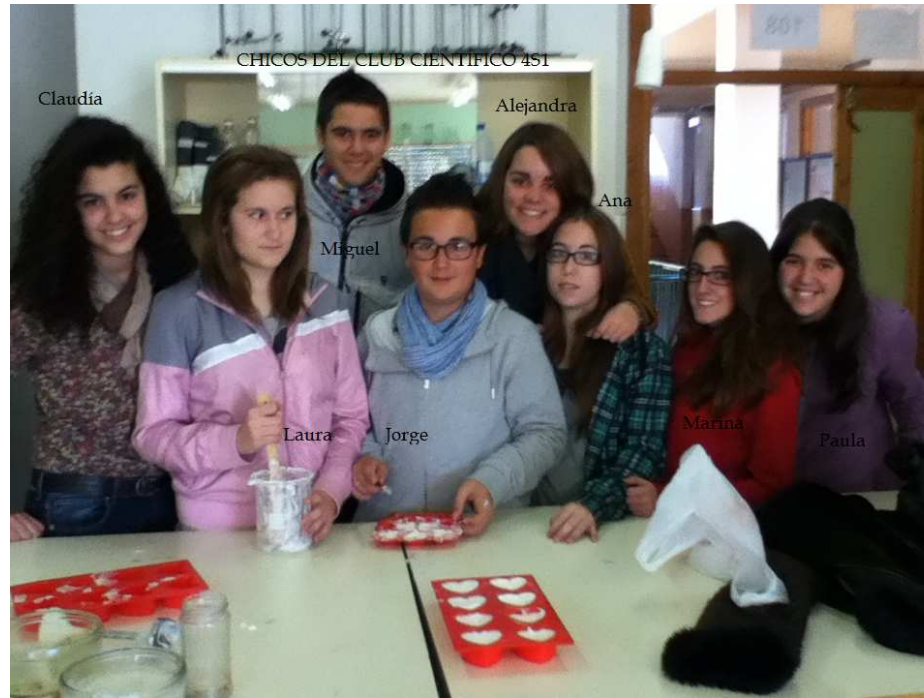
Los chicos del club y su profesora