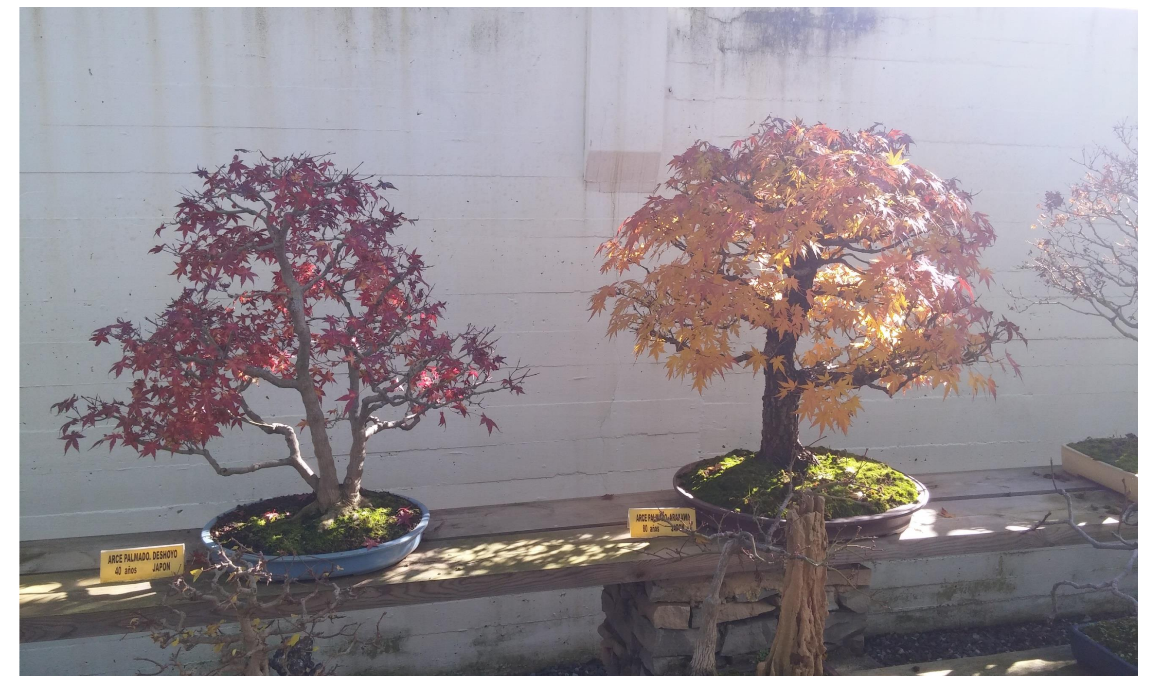
Arce Palmado ( Acer palmatum )