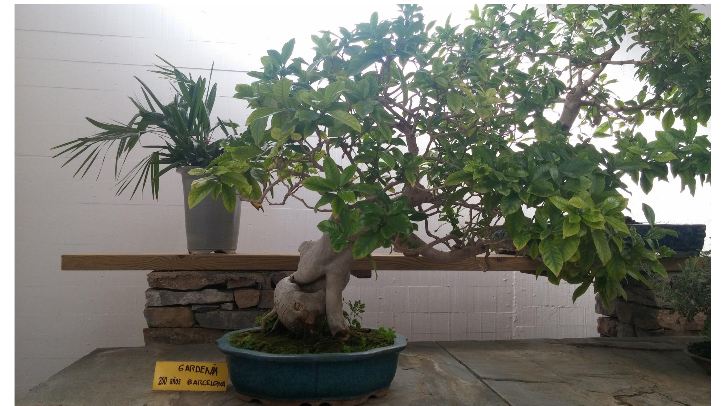
Gardenia ( Gardenia jasminoides )