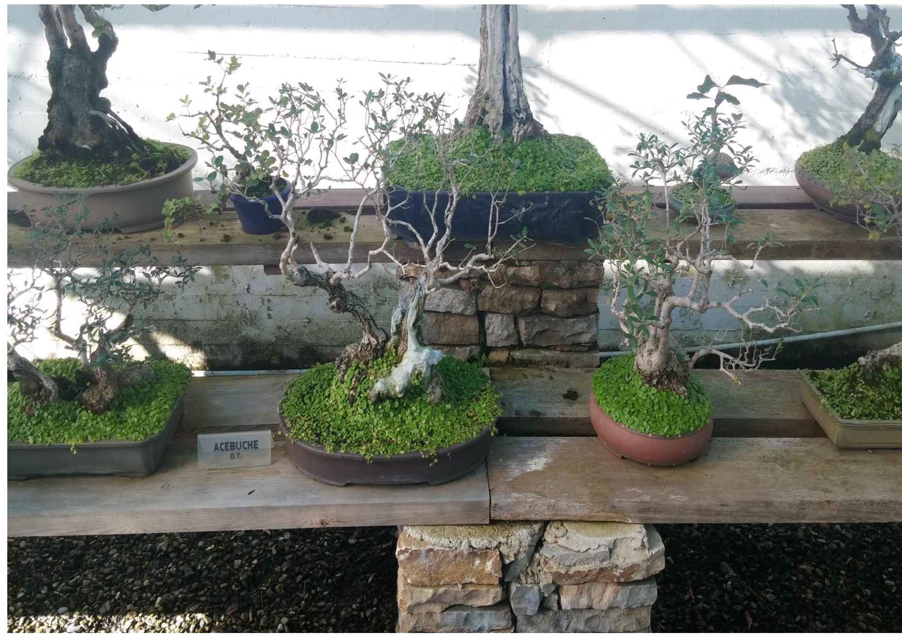
Acebuche ( Olea europea )