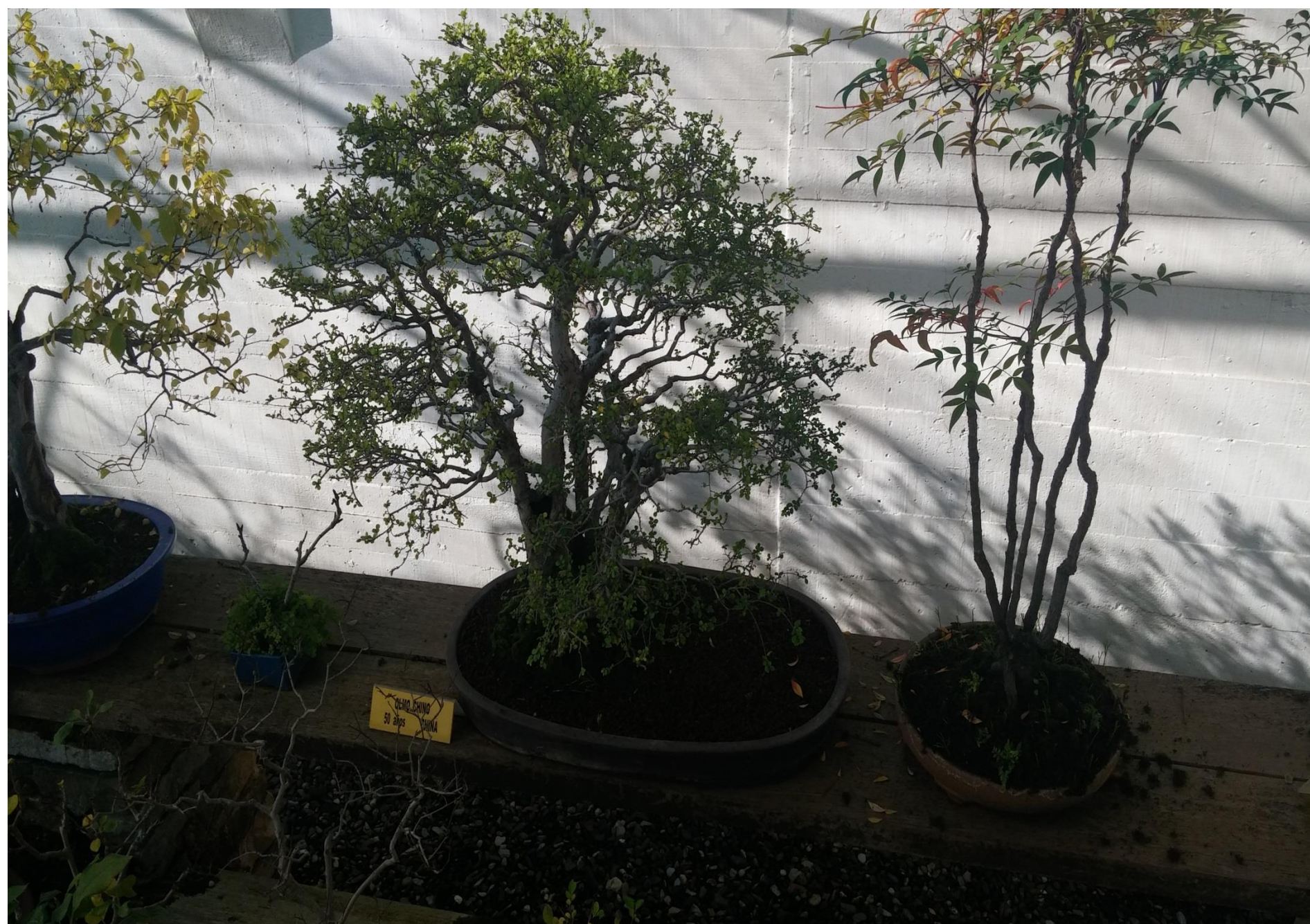
Olmo ( Ulmus parvifolia )